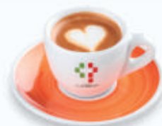
カフェ マッキヤート Caffè Macchiato