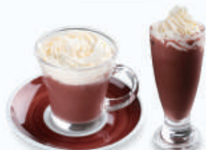
チョコラータ コンパナ Chocolata Con Panna