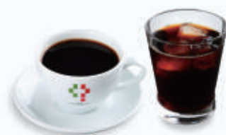
ドリップコーヒー Drip Coffee