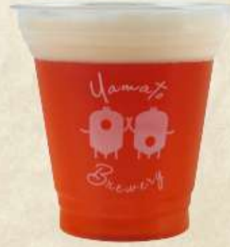
IPA India Pale ale