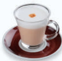
ラッテ マッキヤート Latte Macchiato