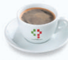
カフェ アメリカーノ Caffè Americano