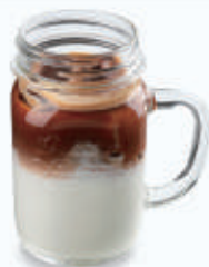
エスプレッソ好きの アイス カフェラッテ Iced Caffè Latte Extra Shot