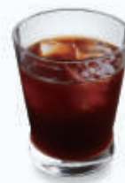
アイス カフェ アメリカーノ Iced Caffè Americano