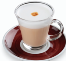
ラッテ マッキヤート Latte Macchiato