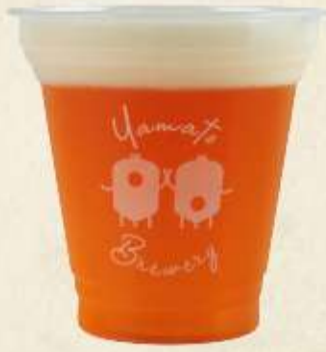
ペールエール Pale ale