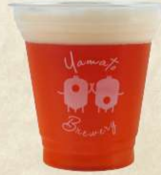
IPA India Pale ale