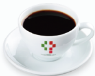
ドリップコーヒー Drip Coffee