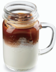
エスプレッソ好きの アイス カフェラッテ Iced Caffè Latte Extra Shot