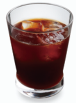
アイス カフェ アメリカーノ Iced Caffè Americano