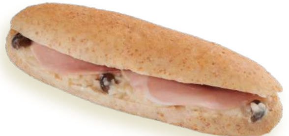
ベシャメルハム Béchamel Sauce & Ham