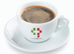
カフェ アメリカーノ Caffè Americano