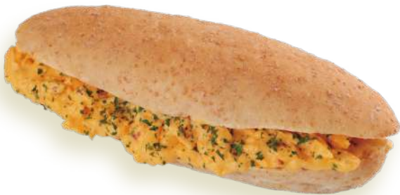
スクランブルエッグ Scrambled Egg